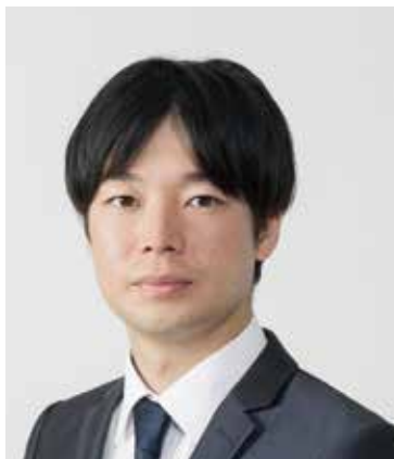
(一般社団法人 Glocal Academy 代表理事、物理学博士)